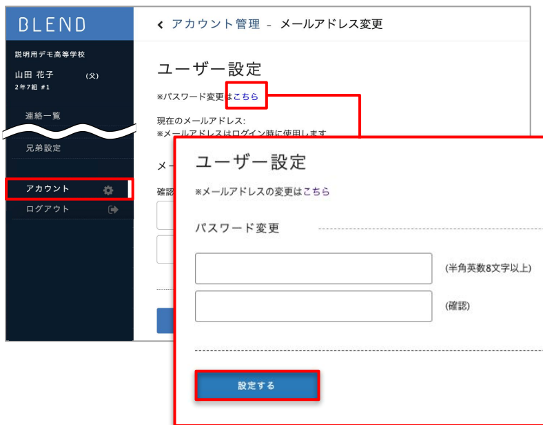
<ブラウザ版画面例>