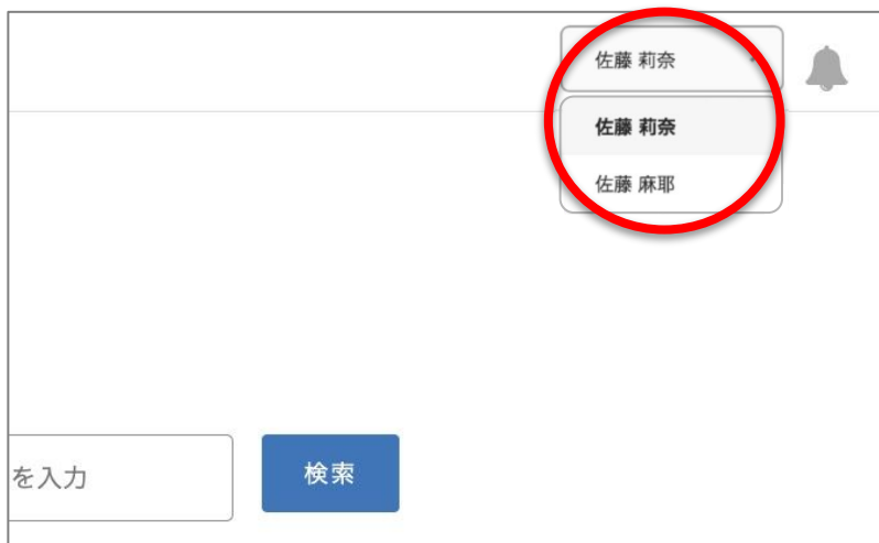
<ブラウザ版>画面右上